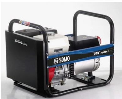
Kohler SDMO HX 7500 T