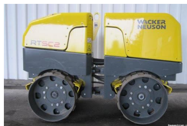
Wacker Neuson RT 82