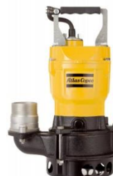
WEDA 04 S