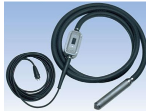
Innenrüttler Lati U