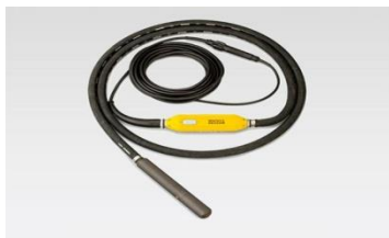
Innenrüttler Wacker IRFU