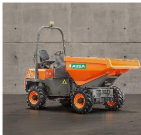
AUSA D 250